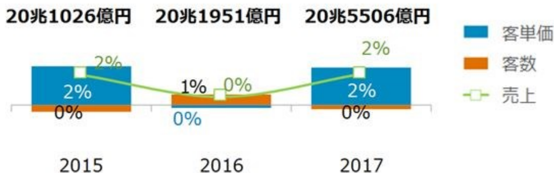
<図表1> 外食・中食市場 成長率

外食・中食市場全体の 2017 年計の成長率（図表 1）をみると、売上（市場規模）は、20 兆 5506 億円で対前年比 2%増、2 期連続（調査開始は 2014 年）のプラス成長となりました。この市場規模の成長は、客単価上昇（+2%）によるものです。客数（食機会数 *2 ）はゼロ成長で、2016 年の 1%増からは一転しました。