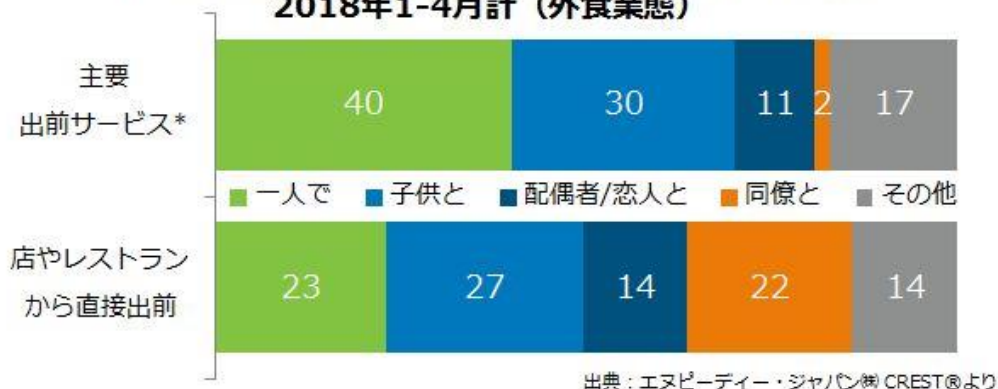
＜図表2＞出前利用時の喫食グループ構成比（食機会数%） 2018年1-4月計（外食業態）

*主要出前サービス：ウーバーイーツ、出前館、ごちクル、dデリバリー、 楽天デリバリー、ファインダイン、LINEデリマ