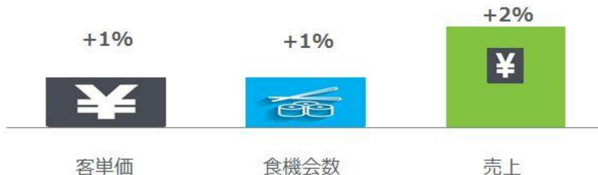
<図表1> 外食・中食市場 成長率 2018年第3四半期 vs. 2017年第3四半期 %

外食・中食市場全体の 2018 年第 3 四半期の成長率（図表 1）をみると、客数（食機会数）が 5 四半期ぶりにプラスに転じ 1%増となりました。客単価も引き続き成長し 1%増加、売上（市場規模）は、5 兆 341 億円で対前年同期比 2%増、8 期連続のプラス成長となりました。