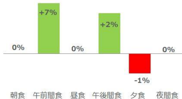
<図表3> 食機会別 食機会数成長率 2018年第3四半期 vs. 2017年第3四半期 %

食機会別の成長率（図表3）をみると、午前間食、午後間食がプラス成長でした。これは、猛暑で飲料の利用が増えたことが影響しています。夕食機会は、相次ぐ自然災害やJRの計画運休などの影響でマイナスとなりました。