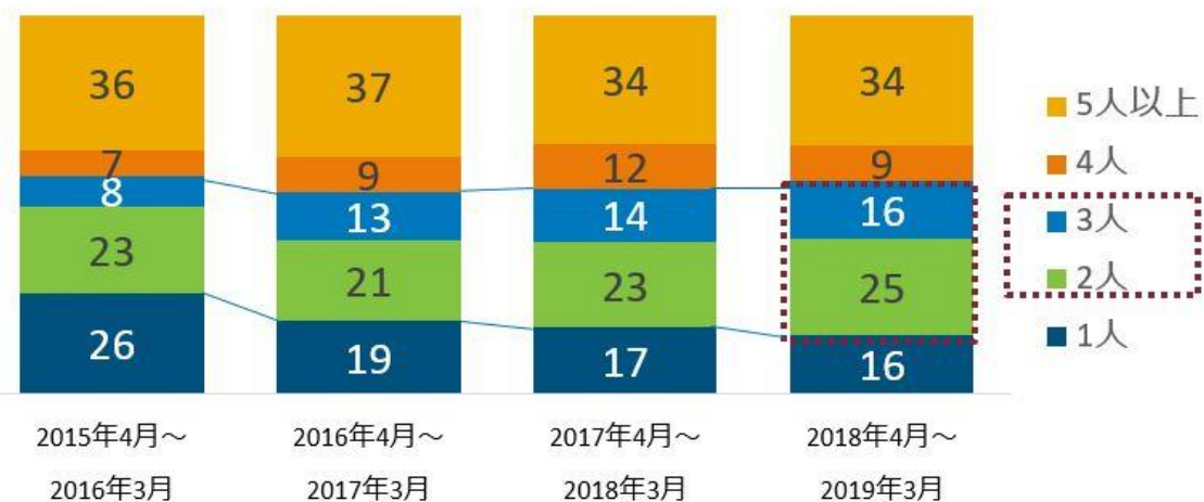
＜図表3＞ 居酒屋テイクアウト利用の際の喫食グループ人数比率 (%)（食機会数ベース）