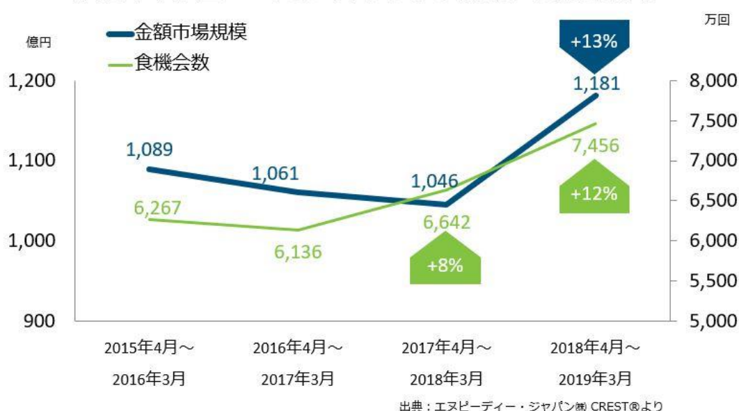
<図表1> 居酒屋におけるテイクアウト市場規模・食機会数推移

居酒屋におけるテイクアウトの市場規模、食機会数推移（図表1）をみると、直近1年（2018年4月～2019年3月）の市場規模は1181億円で、前年同期比13%増でした。客数にあたる食機会数は同12%増で、こちらは2年連続の大幅増となりました。