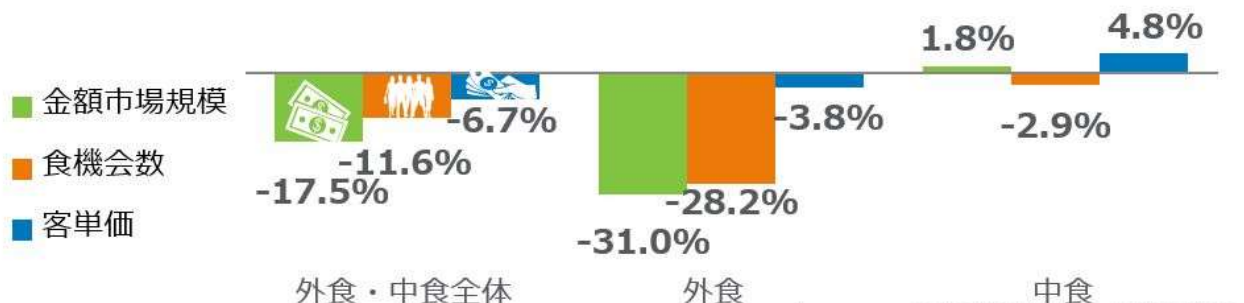
<図表1> 外食・中食市場 成長率 2020年9月計 vs. 2019年9月計 %

外食・中食市場全体の2020年9月の前年同月比（図表1）をみると、売上（金額市場規模）が17.5%減少、客数（食機会数）が11.6%減少しました。感染拡大による影響のピークは、2020年4月で市場規模41.9%減でした。5月は37.7%減、6月は23.6%減、7月は19.4%減、8月は19.8%減で、9月は8月より2.3ポイント回復しました。食機会数は8月より0.1ポイント回復しました。