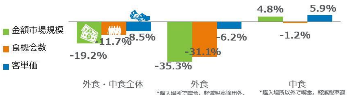
<図表1> 外食・中食市場 成長率 2020年12月計 vs. 2019年12月計 %

外食・中食市場全体の2020年12月の前年同月比（図表1）をみると、売上（金額市場規模）が19.2%減少、客数（食機会数）が11.7%減少しました。感染拡大による影響のピークは、2020年4月で市場規模41.9%減でした。5月37.7%減、6月23.6%減、7月19.4%減、8月19.8%減、9月17.5%減、10月8.9%減、11月12.4%減で、12月は11月より6.8ポイント後退しました。