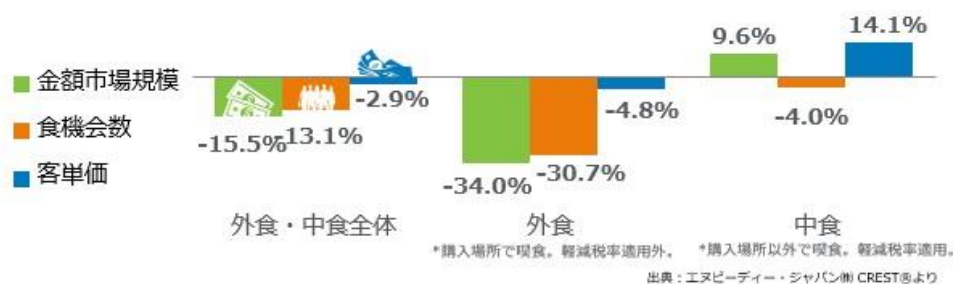
<図表1> 外食・中食市場 成長率 2022年1月計 vs. 2019年1月計 %

外食・中食市場全体の2022年1月の2019年同月比（図表1）をみると、売上（金額市場規模）が15.5%減少、客数（食機会数）が13.1%減少しました。感染拡大による影響のピークは、2020年4月で市場規模前年同月比41.9%減でした。2020年10月には8.9%減まで回復したものの、その後の感染拡大で再び悪化しました。2021年は1月26.3%減、2月24.4%減、3月21.9%減、4月23.7%減、5月26.3%減、6月は27.6%減、7月は19.9%とやや改善したものの、8月は感染が急拡大して27.3%減と再び悪化、9月は酒類提供自粛で客単価が下がり、28.8%減とさらに悪化しました。10月に全都道府県で緊急事態宣言が解除され12.1%減、11月12.0%減、12月10.7%減と横ばいでした。年明け後、オミクロン株によって感染が急拡大したため、1月末までにまん延防止等重点措置が34都道府県下に適用となり、2022年1月は15.3%減と回復が後退しました。