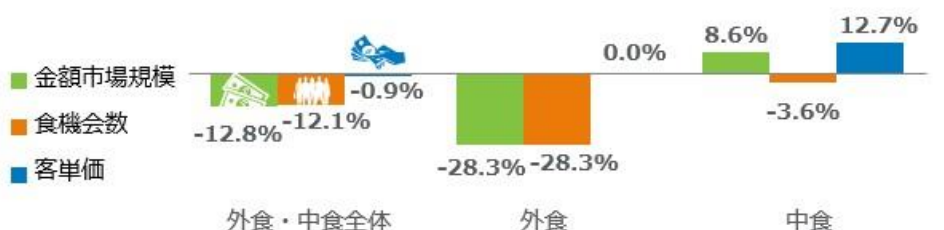
<図表1> 外食・中食市場 成長率 2022年4月計 vs. 2019年4月計 %

外食・中食市場全体の2022年4月の2019年同月比（図表1）をみると、売上（金額市場規模）が12.8%減少、客数（食機会数）が12.1%減少しました。感染拡大による影響のピークは、2020年4月で市場規模前年同月比41.9%減、2020年10月には8.9%減まで回復したものの、その後の感染拡大で再び悪化しました。2021年は1月26.3%減、2月24.4%減、3月21.9%減、4月23.7%減、5月26.3%減、6月は27.6%減、7月は19.9%とやや改善したものの、8月は感染が急拡大して27.3%減と再び悪化、9月は酒類提供自粛で客単価が下がり、28.8%減とさらに悪化しました。10月に全都道府県で緊急事態宣言が解除され12.1%減、11月12.0%減、12月10.7%減と横ばいでした。年明け後、オミクロン株によって感染が急拡大しまん延防止等重点措置（以下、まん防）が適用され、2022年1月は15.3%減、2月はまん防の適用地域拡大・延長となり21.5%減、3月は21日をもって全地域でまん防が解除となり18.3%減、4月は3年ぶりに制限のない大型連休を月末に迎えて、同12.8%減と回復基調が続きました。