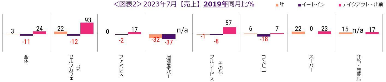
<図表2> 2023年7月【売上】2019年同月比%