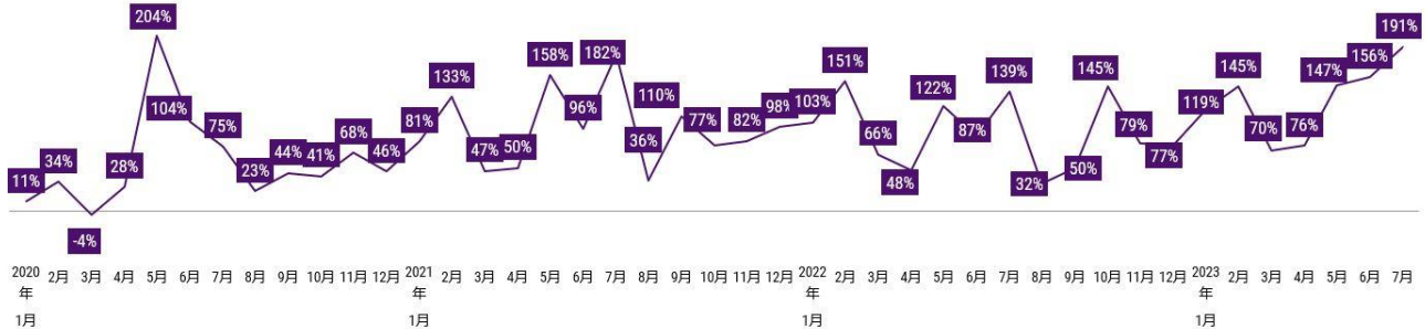
<図表3> 外食業態（レストラン）の出前（デリバリー）売上 - 2019年同月比

* 小売店、弁当・惣菜店、自動販売機、学食・社食を除くレストラン業態（宅配ピザ含む）における宅配