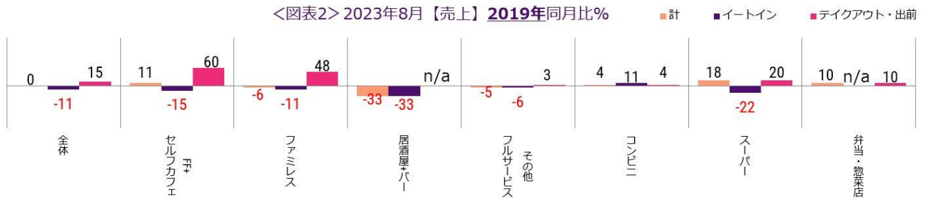
<図表2> 2023年8月【売上】2019年同月比%