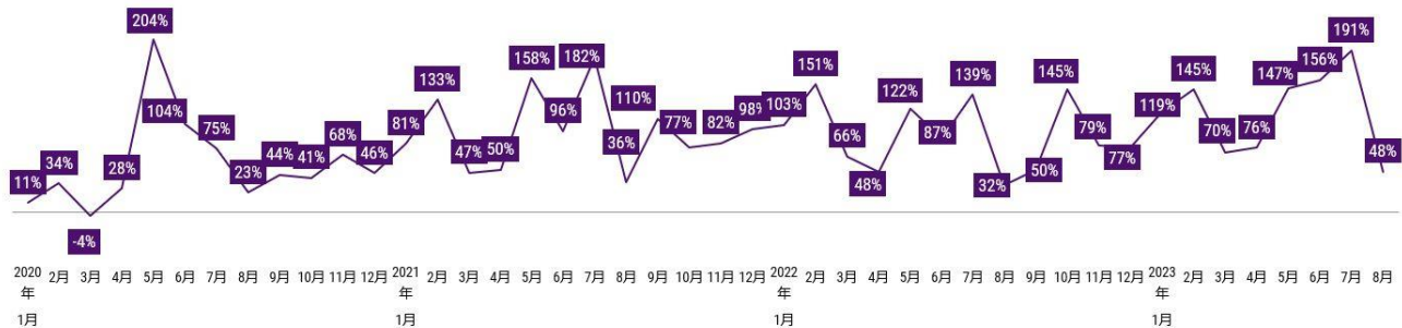
<図表3> 外食業態（レストラン）の出前（デリバリー）売上 - 2019年同月比

*小売店、弁当・惣菜店、自動販売機、学食・社食を除く レストラン業態（宅配ピザ含む）における宅配